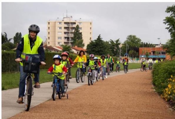
Line de Vélo-bus [6]

Les actions à mettre en place par la suite dépendront donc des objectifs fixés par chaque école et devront donc être adaptées pour être cohérentes. Des mesures d'accompagnement peuvent venir appuyer les actions mises en place pour les rendre plus efficaces (ex : Dans le cadre de la mise en place d'un pédibus/vélo-bus, il est judicieux d'installer des aménagements sécurisants leurs itinéraires, d'un parking à vélo, etc...)