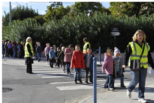
Ligne de Pédibus [7]

L'annexe 1 de cette note recense plusieurs actions phares souvent mises en place dans les différents PDES. Air PACA peut proposer éventuellement son expertise et/ou son accompagnement selon les actions choisies.